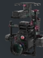
RONIN-MX + RED EPIC