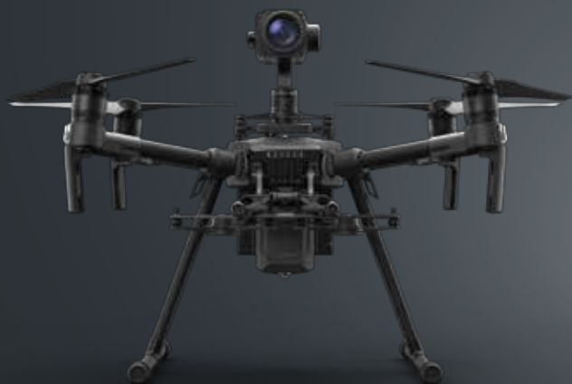
Single Upward Gimbal