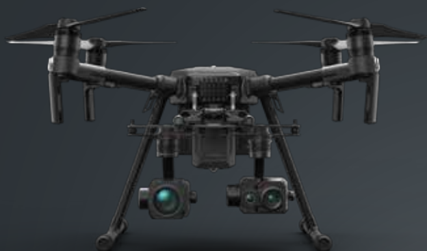
Dual Downward Gimbal