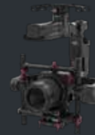
RONIN-MX + HASSELBLAD A5D