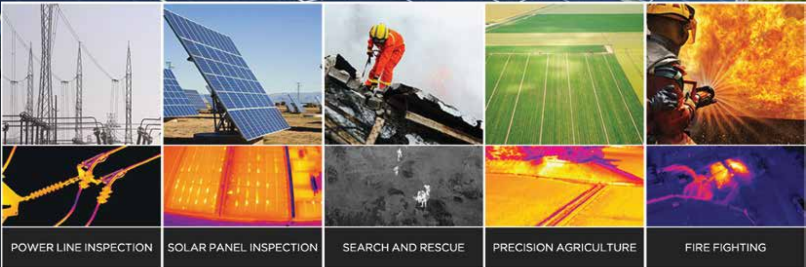
POWER LINE INSPECTION