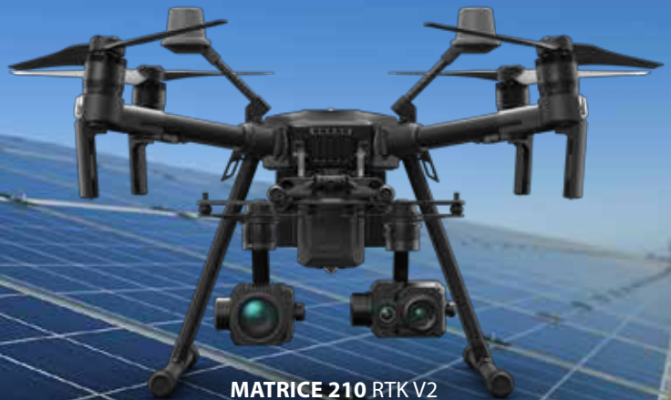
MATRICE 210 RTK V2